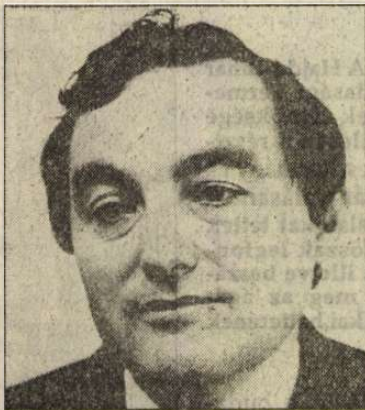
Éles Csaba újabb témája: az önismeret dimenzióinak vizsgálata

– A Moszkvában élő, de a szovjet fővárost elhagyni készülő Lukács 1945-ben három ajánlatot kapott. Egyetemi tanárnak hívta a